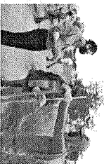
En la imagen, el Alcalde Evaristo Bertrán Benavides supervisando el programa "Empléate en tu Parque".

El programa "Empléate en tu Parque" tiene como objetivo generar empleo a los jóvenes de la ciudad de Juárez, a través de la creación de microempresas y emprendimientos en los parques de la ciudad.